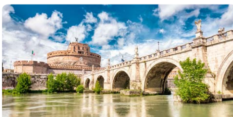
Civitavecchia • Italien