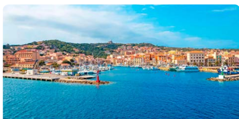
Olbia • Italien