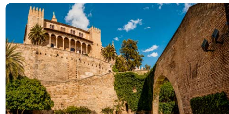
Palma de Mallorca • Spanien