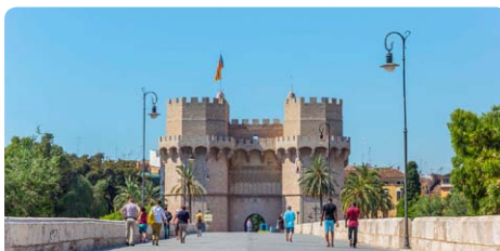
Valencia • Spanien