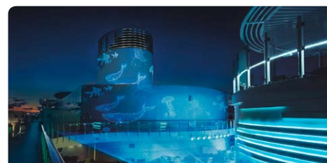
'Light Show' • Walschutzgebiet