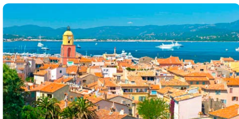
La Seyne-sur-Mer • Frankreich

Mediterrane Rundreise zu malerischen Orten und historischen Schätzen